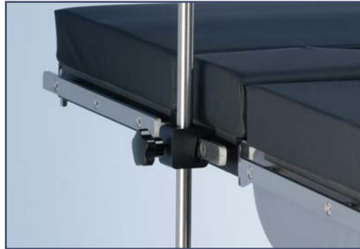
Зажим простой, алюминий. \varnothing 18 мм.: Код 60264 \varnothing 20 мм.: Код 61264