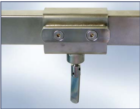
Расширяющий рельс. Код ES15334