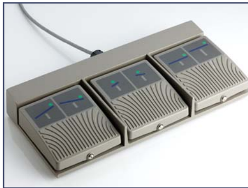
Ножной пульт управления на 3 программируемые функции. Код 60270