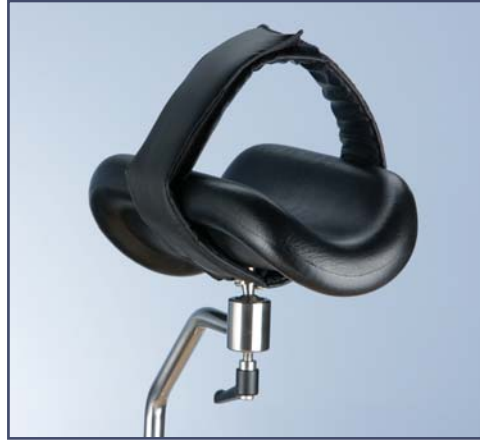
Мягкий ремень для крепления ноги. Код 10452