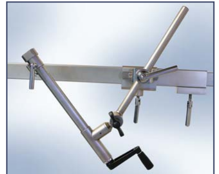
Тяговое устройство для вытяжения, необходимы рельс ES15334 и зажим 61283. Код 60291