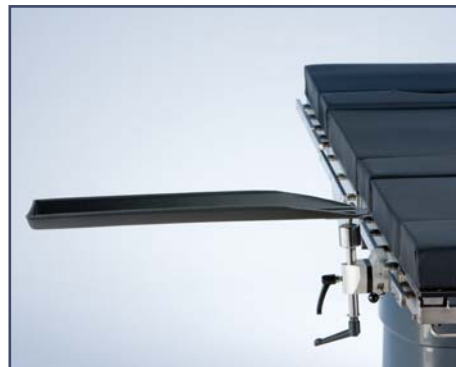
Рентгенпрозрачная опора для руки, включая зажим. Код 10385