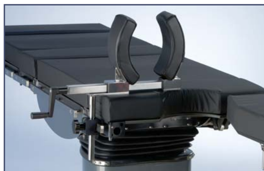
Держатель ноги при артроскопии. Код 6128920. Необходим зажим 61264 или 61283