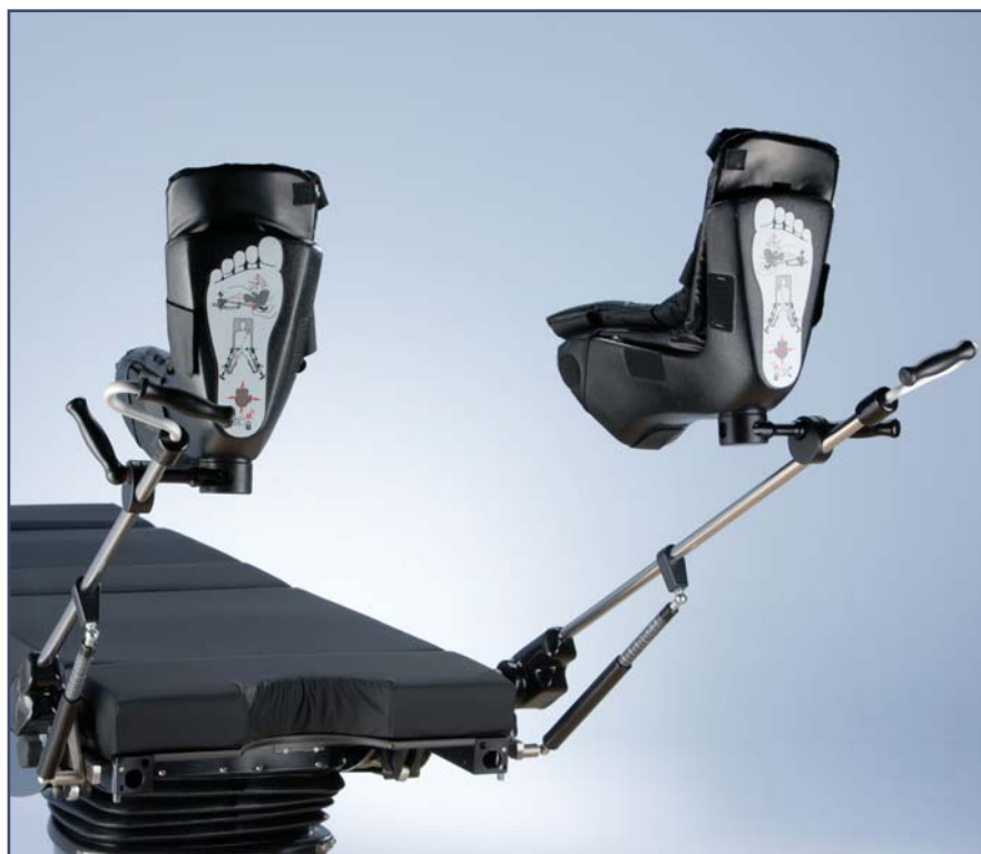
Опоры для ног с возможностью 3D движения, пара. Позволяют провести легкое позиционирование пациента (абдукцию) при литотомии, поддерживая стерильную зону. Код 60320. Необходимы зажимы 60200 – 2 шт.