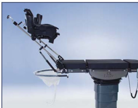
Система мочеприема Uro Catcher (код 60324). Гибкая рамка позволяет хирургу свободно и беспрепятственно приближаться к пациенту. Рамка легко возвращается в первоначальное положение. Система совместима со всеми современными отсосами. В комплекте с 10-ью стерильными пакетами, код 60235