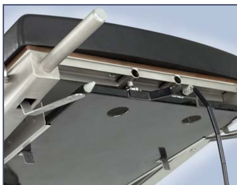
Держатель рентгенкассеты (для кассет размером до 465 x 390 мм.) Код 60116.