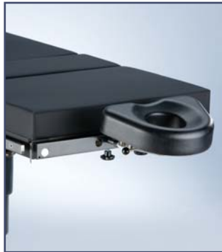
Головная секция для ЛОР операций, пластической хирургии и офтальмологии, гибкая. Код 60327. Необходим адаптер 60110