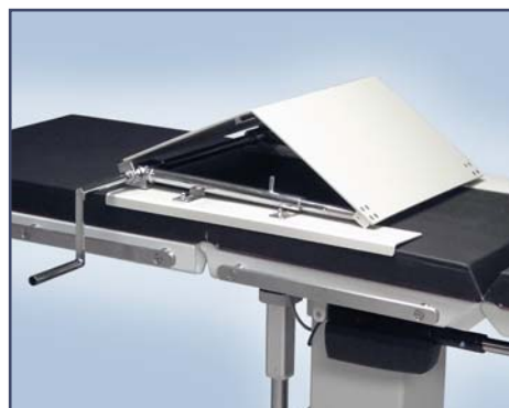
Приставка для операций на почках. Код 6010480. Регулируемая ширина (490-550 мм.). Совместима с различными операционными столами