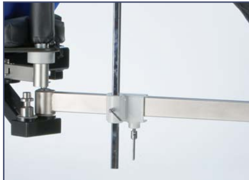
Зажим для ортопедической приставки. Код ES106