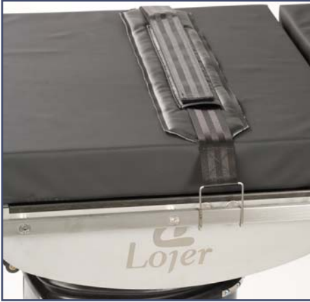
Мягкий ремень для ног и туловища, широкий. Код 10464