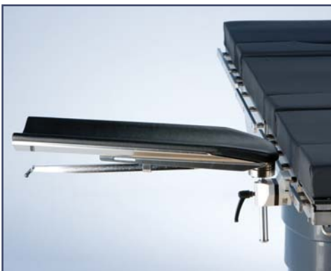
Вогнутая литая подушка для опоры для руки. Код 10382