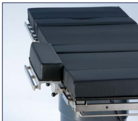
Дополнительные расширяющие боковые секции стола (пара), включая матрасы, длина 500 мм. Код 10423