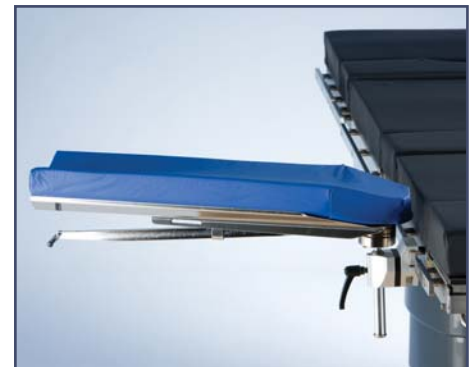
Вогнутая мягкая подушка для опоры для руки. Код 10382Н