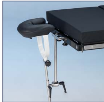
Головная секция для нейрохирургии (необходим адаптер 60110). Код 6010335.