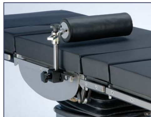
Валик горизонтальный, необходим зажим 61264 или 61283. Код 10369.