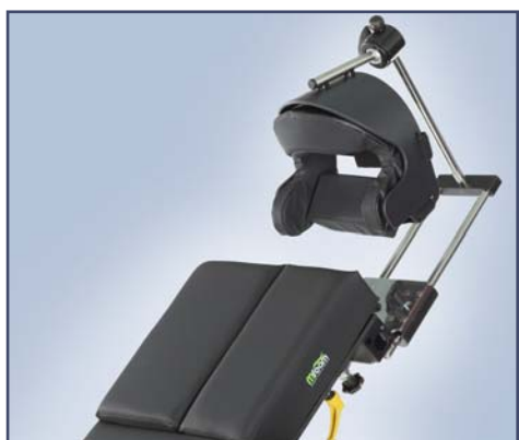
Специальный модуль для операций на плече. Электропривод угла расположения. Съемные боковые секции. Регулируемый подголовник в комплекте с подушками. Код 60280-2