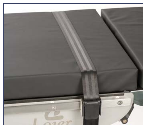
Ремень для крепления ног. Код 10372