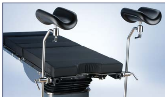
Опоры для ног по Гепелю с шаровым механизмом. Код 10450. Необходимы зажимы 61283 – 2 шт. Рекомендована комплектация ремнями