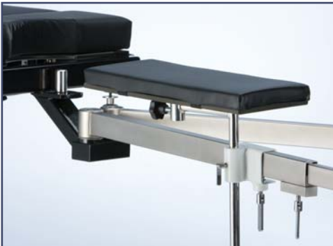
Платформа для ноги. Код 61120110