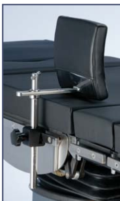
Боковой упор (r20 мм.), широкий. Код 51461416 Боковой упор (r20 мм.), узкий. Код 61406 Оба требуют зажим 61264 или 61283.