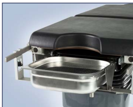
Емкость гинекологическая с дренажом. Код 60335.