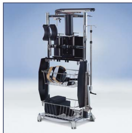
Тележка для принадлежностей. Код 60250