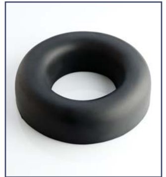
Круглая подушка под голову. Код 10333