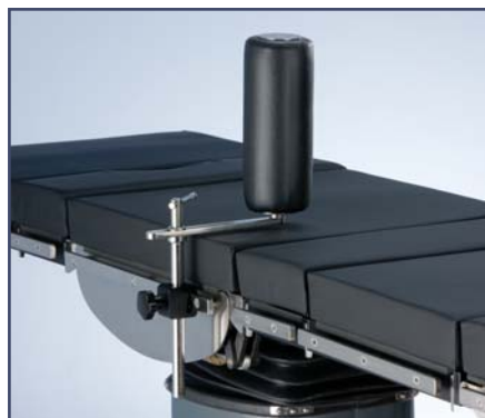
Валик вертикальный, необходим зажим 61264 или 61283. Код 61421.