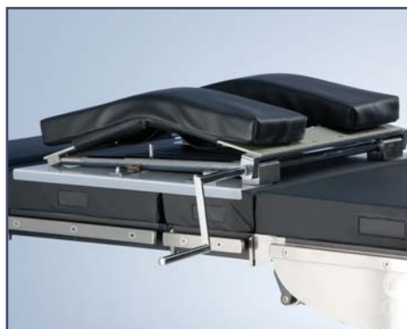
Приставка для ламинэктомии, механическая регулировка. Код 6010485