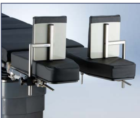
Разделенные упоры для ступней, пара, необходим зажим 61264 - 2 шт. или 61283 - 2 шт. Код 7510175.