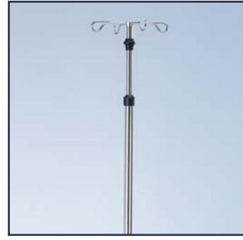
Инфузионная стойка \varnothing 18 мм., регулировка по высоте одной рукой, нержавеющая сталь. Код 60120. Необходим зажим 60264.