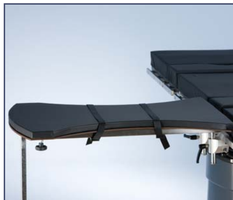
Столик для операций на руке со складывающейся опорной ножкой, включая зажим, код 10390