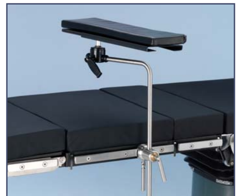
Многофункциональный столик для руки с функцией горизонтального перемещения платформы на 15 см., код 60322