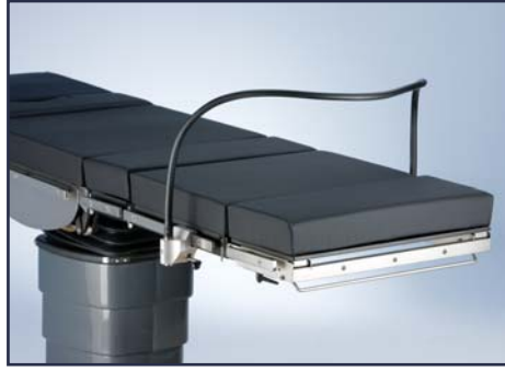
Анестезиологический экран, гибкий, включая зажимы. Код 10311