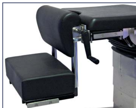
Проктологическая приставка. Код 6010440F. Регулировка высота 490-690 мм. Безопасная рабочая нагрузка 200 кг.