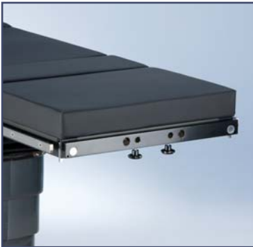
Адаптер для специальных головных секций (по Майфельду). Код 60110