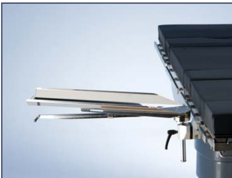
Опора для руки, включая зажим, без подушки, код 10380. Модель 6010387 (без подушки, включая зажим) имеет функцию ротации.