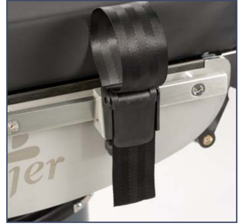
Ремень для крепления запястья (включая зажим). Код 10370