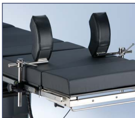
Упоры для плеча, пара, необходим зажим 61264 - 2 шт. или 61283 - 2 шт. Код 61253