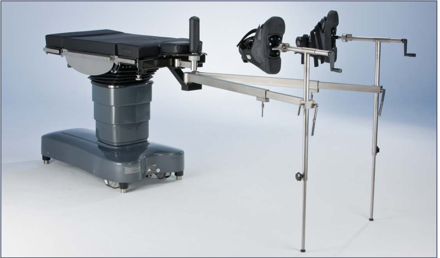
Ортопедическая приставка для проведения операций на нижних конечностях. Код 60290