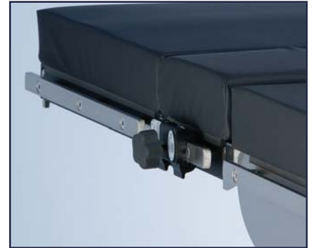
Зажим Easy lock для клинков с плоским лезвием. Код 60200