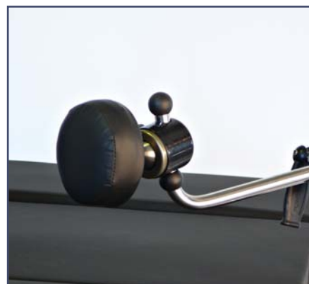
Боковой упор вращающийся, круглый, необходим зажим 60200. Код 603211.