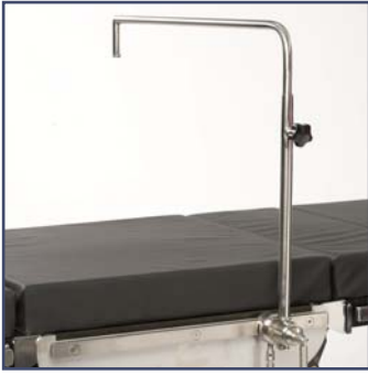
Анестезиологический экран, включая зажим. Код 10310. Рекомендована комплектация расширяющей рамкой (код 60328)