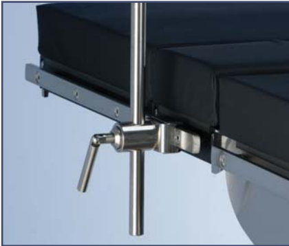
Зажим радиальный зубчатый, с возможностью регулировки угла расположения аксессуара ( \varnothing 20 мм.) Код 61283